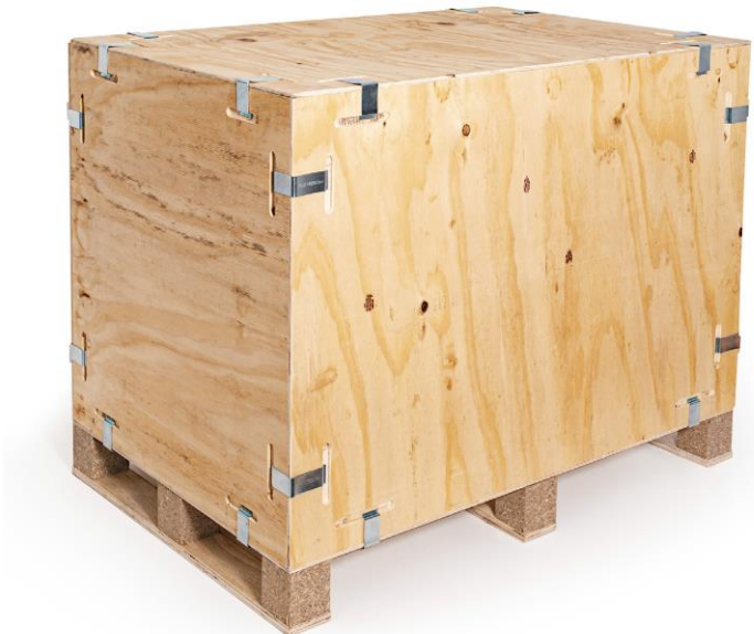
ReloClip Standard S3